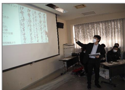
作品作成ワンポイント解説