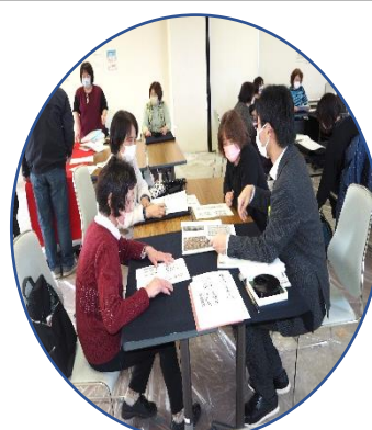
各部門に分かれての研修会模様